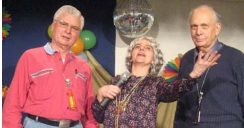
Unsere Fotografen diesmal vor der Kamera