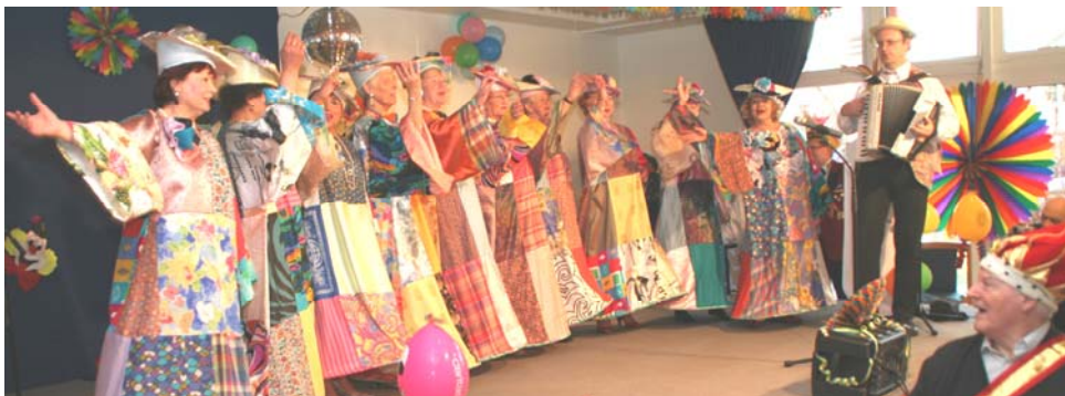
6 Wie in jedem Jahr besuchten uns die „Mannheimer Weiber“ und brachten mit ihren Liedern Stimmung in den Saal.