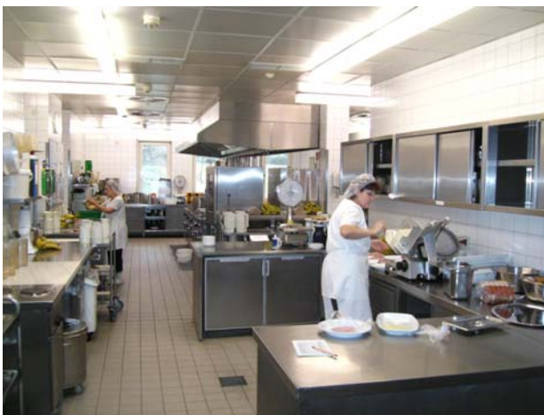
Die Küchenmitarbeiter bei Vorbereitungen

hinaus kommen manche Sonderaktionen wie z.B. Feste, Konferenzen, Tagungen dazu die den Alltag unterbrechen. Auch Gäste aus Stadt, Verband, Kirche wissen um die Qualität der Küche. Eine Obdachlosenspeisung in Zusammenarbeit mit der Pfarrei ist ebenfalls eine große Herausforderung.